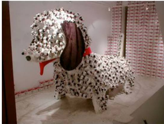
彭弘智 Peng Hung Chih